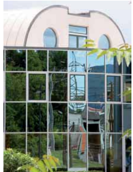
Ihre Vision - Badens Zukunft.

Wenn Sie eine Idee zur Stadtentwicklung einreichen wollen, dann füllen Sie bitte das nachfolgende Formular aus und senden es entweder an: Stadtgemeinde Baden, Stadtentwicklung „baden.2031“, Hauptplatz 1, Baden, oder werfen Ihren ausgefüllten Beteiligungsbogen in die „Ideenbox“ im Bürgerservice der Stadt Baden. ■