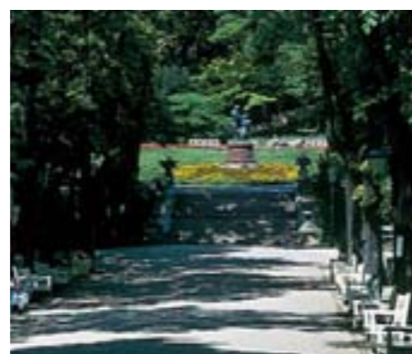
Lanner & Strauß im Kurpark