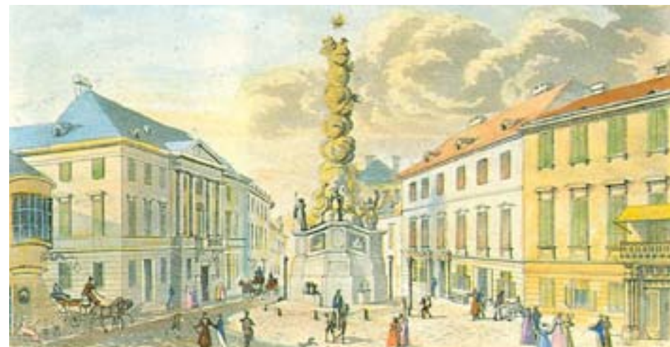
Colorierter Stich von Ed. Gurk: Hauptplatz