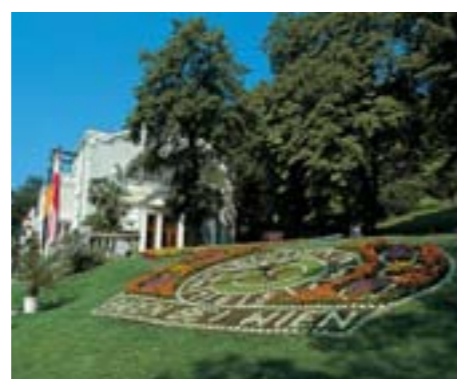
Sommerarena mit Blumenuhr

Sonst ging es fröhlich zu in Baden. Johann Strauß Vater und Josef Lanner konzertierten im Kurpark und auf der Hauswiese im Helenental. Johann Strauß Sohn siedelte seine Operette „Die Fledermaus“ in einem Kurort südlich von Wien an - das kann doch wohl nur Baden gewesen sein. Karl Millöcker und Carl Michael Ziehrer lebten in Baden, und Karl Komzak war hier Musikdirektor. Der geniale Theatermann Max Reinhardt wurde in Baden geboren, und eines der bedeutendsten und tiefgründigsten Stücke Arthur Schnitzlers , „Das weite Land“, spielt ebenfalls in diesem besonderen Milieu.