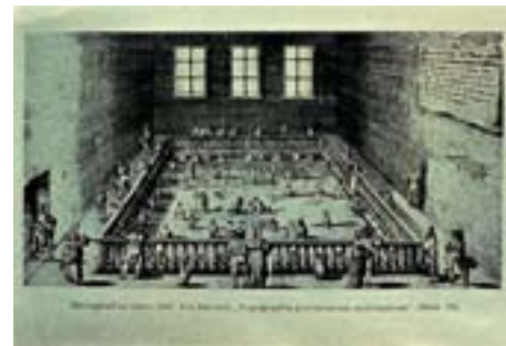
Herzogbad zu Baaden, Stich aus 1649