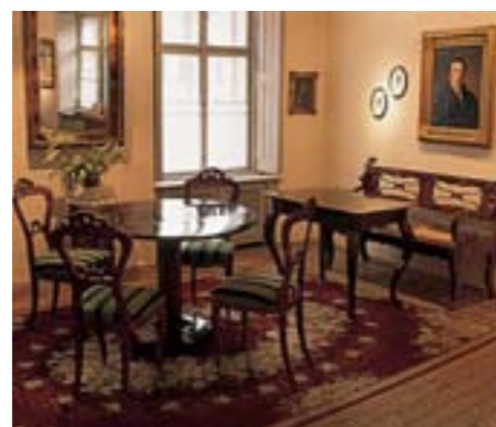
Beethovenhaus, Rathausgasse 10