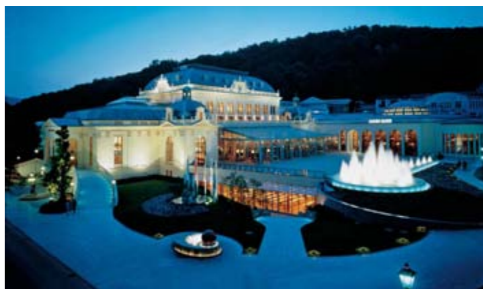
Congress Casino Baden

Impressum: Inhaber und Verleger: Geschäftsgruppe Tourismus und Wirtschaft der Stadtgemeinde Baden bei Wien A-2500 Baden, Leopoldsbad, Brusattiplatz 3 Herstellung: Verlag Weiss, Deggendorf Februar 2006 (Deutsch)