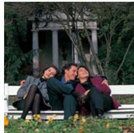
Mozarttempel im Kurpark