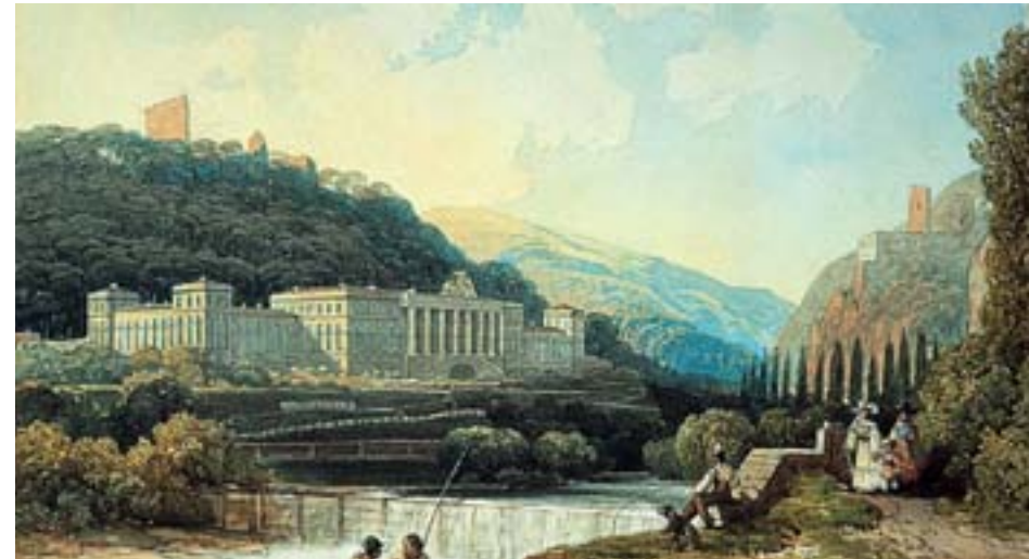
Aquarell von Thomas Ender: Weilburg