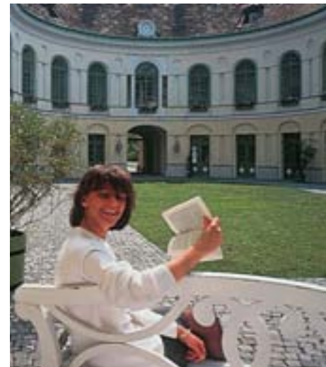
Sauerhof / Innenhof