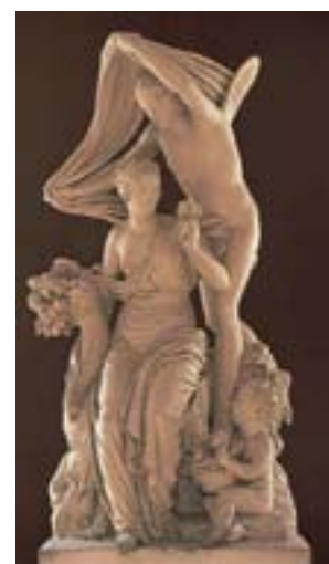
◁Josef Klieber: Flora & Zephyr F. Heinrich: Schlafzimmer Erzh. Karls in der ehemaligen Weilburg Schale mit Ansicht: Weilburg ▽