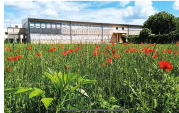
Der neue AHS-Campus Baden erhält einen biodiversen Rahmen.

Dieses Projekt wird mit einer Gesamtsumme von 5.800 € durch den