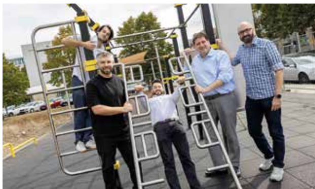
Open Air Calisthenics Park: Viele Trainingsmöglichkeiten unter freiem Himmel