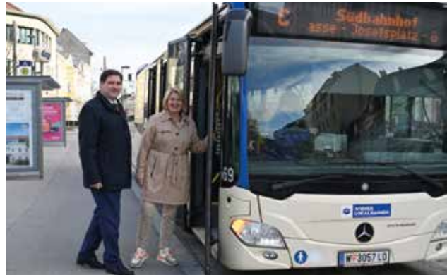
Der Citybus wird künftig elektrisch unterwegs sein.