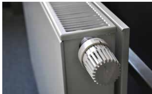
Was Sie bei Radiatoren beachten sollten.

Dämmen der Rohre im Heizkeller: Mit gut gedämmten Rohren und Armaturen für Heizung und Warmwasser wird Geld gespart - kaum eine andere