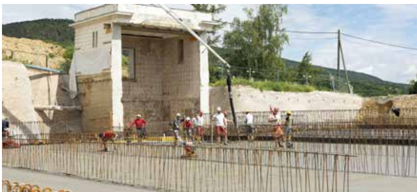
Ein neuer Hochwasserbehälter entsteht am Badener Berg

Die Schieberkammer des alten Behälters bleibt aus Gründen des Denkmalschutzes erhalten.