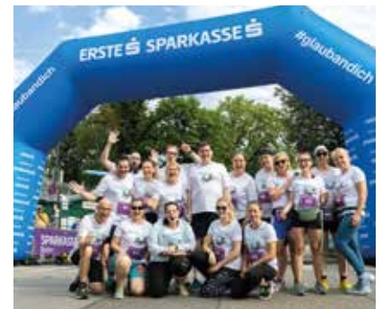
Das Baden mobil-Team mit Bürgermeister Stefan Szirucsek.

Äußerst erfolgreich schnitt dabei das Team der Stadtpolizei Baden ab, das im Mixed-Teambewerb den 2. Platz erlaufen konnte. Mit einer beeindruckenden Teilnehmerzahl und vielen Teams trat auch die FF Baden-Weikersdorf