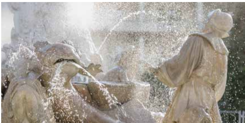
Der Zauber liegt auch im Detail

Die Generalplanung erfolgte durch die MOMENTUM GmbH, einem Büro für Restaurierungsplanung und Denkmalpflege. Das Restaurierungskonzept und die umfangreichen Arbeiten am Brunnen wurden fachlich mit dem Bundesdenkmalamt abgestimmt. Die erfolgreiche Sanierung des Undinebrunnens ist das Ergebnis der fachkundigen Zusammenarbeit von Fachplanern, Restauratoren, Bildhauern, Installateuren, Baufirmen und Technikern. Die Koordination von Planung und Umsetzung lag bei den Badener Stadtgärten, die auch für die Gestaltung des Umfeldes und damit einen neuen, blühenden Rahmen des Undinebrunnens gesorgt haben.