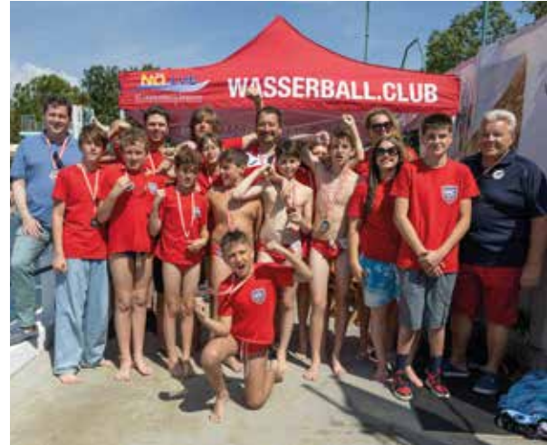
Das U12-Team des BAC triumphierte