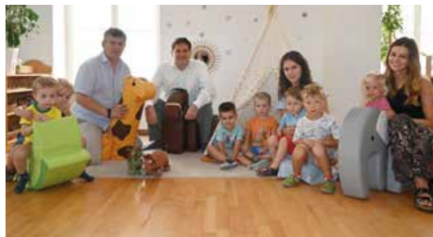
Guter Start für Badens Jüngste

Die Mädchen und Burschen wurden in allen 11 Badener Kindergärten aufgenommen, betreut werden sie in insgesamt 45 Kindergartengruppen. Um den zusätzlichen Bedarf durch die Aufnahme der 2-Jährigen decken zu können, wurden zwei zusätzliche Gruppen im Kindergarten Melkergründe und eine zusätzliche Gruppe im Kindergarten