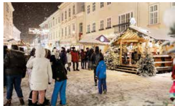
Charity-Advent am Hauptplatz