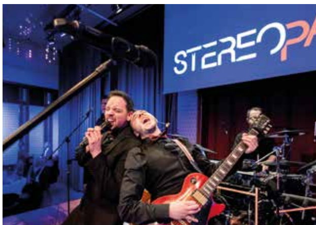
Stimmungskanonen Stereoparty in Action

Wer die Übertragungen vom Wiener Opernball mitverfolgt, wird im Festsaal „alte Bekannte“ wiedersehen. Denn bereits zum zweiten Mal ist das Wiener Opernball Orches-