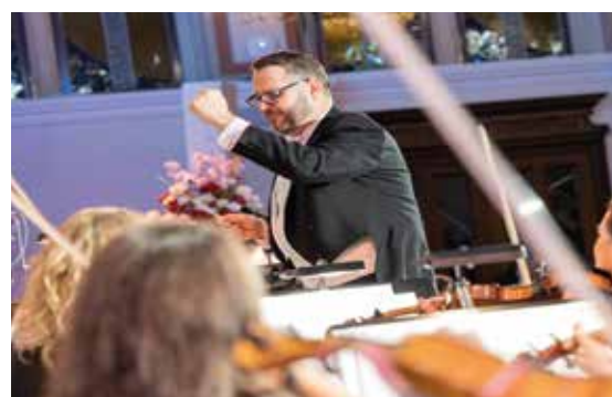
Das Wiener Opernball Orchester in Baden