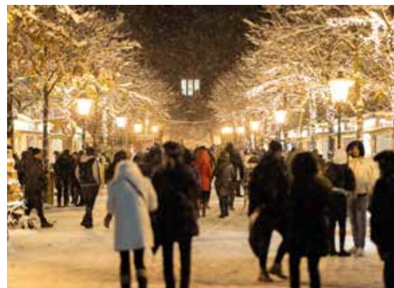
Eintauchen und genießen