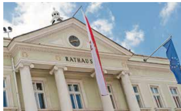
Voranschlag in herausfordernden Zeiten

Batteriespeicher Pumpwerk Ebenfurth: 320.000 €