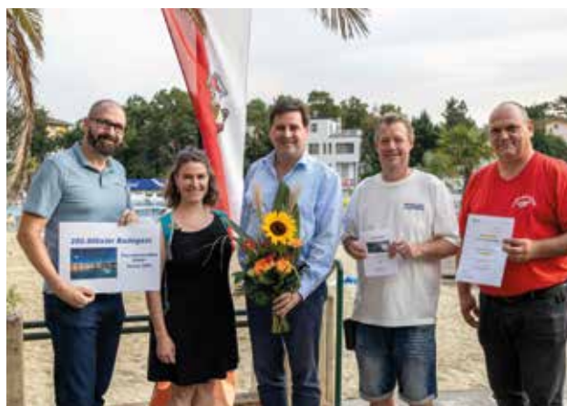
Blumen und Gutscheine als Dankeschön

Bürgermeister Stefan Szirucsek freut sich über eine überaus gute Badesaison: „Trotz des witterungsbedingten, schwachen Startes im Frühsommer hat sich die Badesaison überaus gut entwickelt, sodass wir die Gästezahl aus dem Vorjahr übertreffen konnten.“ ■