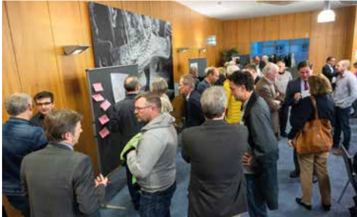
Reges Interesse herrschte im April 2024 beim Bürgerabend zur Neugestaltung der Unteren Wassergasse.