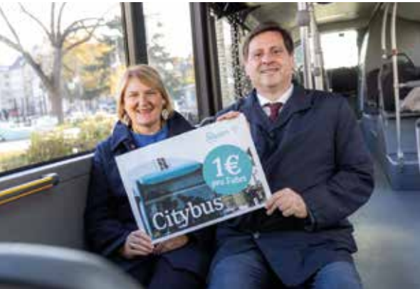
Innerstädtisch günstig unterwegs

Neuer E-Citybusbetrieb mit moderner Busflotte