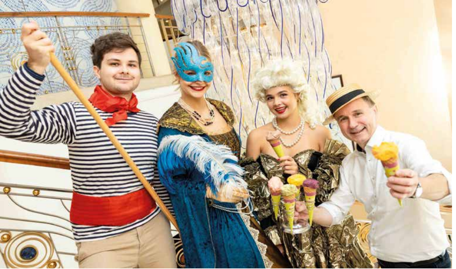
„La Dolce Vita“ in seiner elegantesten Form beim Ball Royale der Stadt Baden 2025