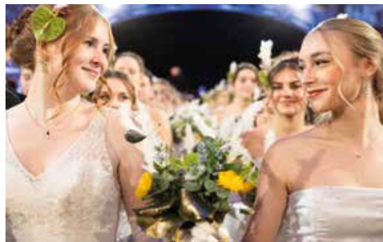
Anmut bei der Eröffnung

VVK: 70 € (inkl. 10 € Jetons), Jugend/Studenten 30 €, Abendkasse: 75 € (inkl. 10 € Jetons), Jugend/Studenten 35 €, Tischreservierung pro Platz: Festsaal 48 €, Badener Saal 35 €, Casineum 33 €, Salon 1&2 33 €. Arrangement Royale pro Person: 255 €. VVK, Info & Tischreservierung: Tourist Info Baden, Brusattiplatz 3, 10 – 16 Uhr, Tel. 02252 86 800-600, info@baden.at , www.ballroyale.at