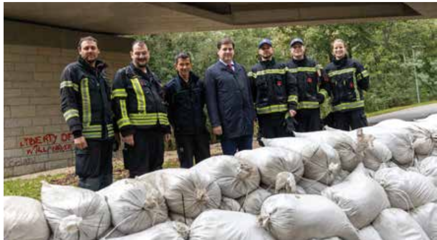
Bürgermeister Stefan Szirucsek bedankte sich bei den Teams der Badener Feuerwehren

chatsohle vermessen, um festzustellen, in welchem Ausmaß Erosion stattgefunden haben. Parallel dazu erfolgt eine Begehung mit einem Sachverständigen, um den Handlungsbedarf an den Ufermauern festzustellen. Die Uferanrainerinnen und Uferanrainer werden vom Ergebnis dieser Begehung informiert. Ausuferungen entlang der Ufermauern können durch Anpassungen der Höhe der Mauerkronen künftig verhindert werden.