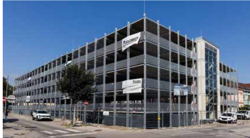
Das neue Parkdeck bietet eine Reihe von Vorzügen

nicht mehr auf das Ablaufen von Parkscheinen geachtet werden muss