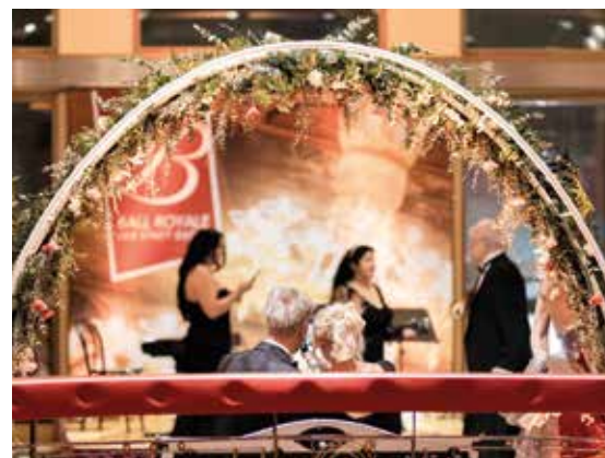
Das Casino Baden wird zur Balllandschaft