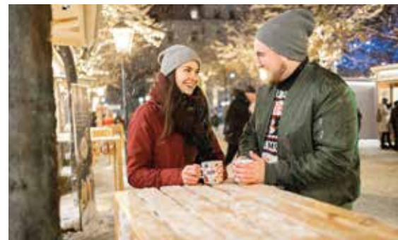
Adventhütten verwöhnen mit heißen Köstlichkeiten