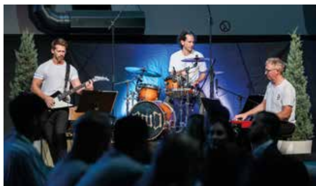
Ein Lehrer-Trio sorgte für die schwungvolle Note.

Alle Fotos der Ehrung finden Sie auf www.baden.at sowie auf der offiziellen Facebook-Seite „Baden bei Wien – Unsere Stadt“.