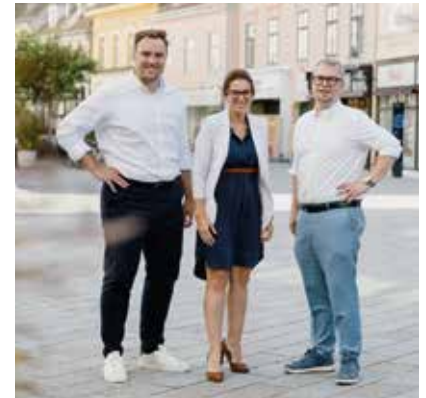
Badens Stadtverantwortliche setzen sich für neue Förderungen ein