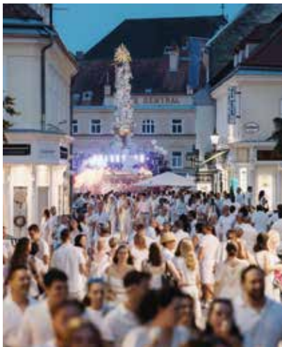
Die lange Einkaufsnacht als Partyevent.

Für das erforderliche Sicherheitskonzept und dessen Umsetzung zeichnet weiterhin die Stadtgemeinde Baden verantwortlich.