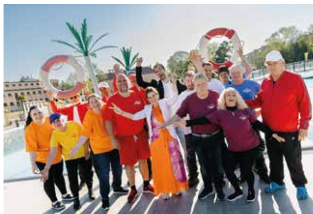
Gute Laune ist im Strandbad seit 100 Jahren Trumpf.

Anlässlich dieses besonderen Geburtstags hat die Stadtgemeinde auch eine neue, hochwertige Merchandise-Kollektion zusammengestellt, die den Charakter des Strandbades sommerlich, zeitlos und mit Liebe zum Detail vermittelt. Klare Designs und sorgfältige Verarbeitung treffen dabei auf ausgewählte Materialien und machen jede Kreation zum exklusiven Mitbringsel oder einem Stück Strandbad-Flair für Zuhause. So lädt z. B. ein historisches Postkarten-Set mit Motiven aus 100 Jahren Badegeschichte – vom eleganten Bau der 1920er-Jahre bis zu lebendigen Szenen vergangener Sommer – zu einer kleinen Zeitreise ein, die nicht nur das Herz von Sammlern höher schlagen lässt – perfekt zum Verschenken oder Sammeln.