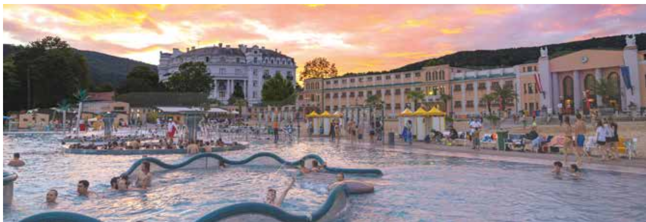
Das Nachtschwimmen zählt seit vielen Jahren zu den beliebtesten Strandbad-Events.