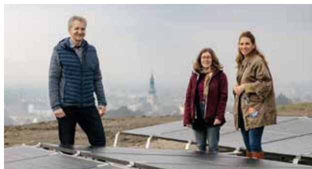
Eine leistungsfähige Solaranlage sichert die Versorgung auch bei Stromausfall.

Die Anlage ist außerdem mit einer Photovoltaikanlage mit einem geschätzten Jahresertrag von rund 52.000 kWh und leistungsfähigen Batteriespeichern mit einer Speicherkapazität von 225 kWh ausgestattet. Damit bleibt die Wasserversorgung auch in Krisenfällen, wie einem großflächigen Stromausfall, funktionsfähig.