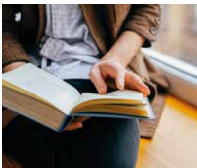
Von 9. bis 13. Juni in der Stadtbücherei Baden kostenlos Bücher entleihen.

unterhaltsamen Geschichten zu vermitteln. Anmeldung in der Stadtbücherei, unter office@buecherei-baden.at oder telefonisch unter 02252 86800-690. ■