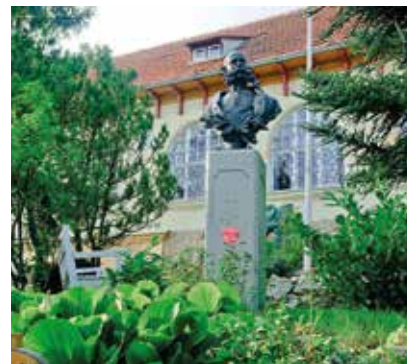
Sonderausstellung im Kaiser Franz Josef Museum

Hoch aufwändig war die Herstellung – hoch aufwändig aber auch das Anziehen und – wie anzunehmen ist – nicht immer angenehm. Durch die Gestaltung von Ausstellungsprofis, die bedeutende Referenzen aufweisen können (Schallaburg, Bundesmuseen usw.), werden diese Objekte in einen qualitativ hochwertigen Rahmen gefasst.