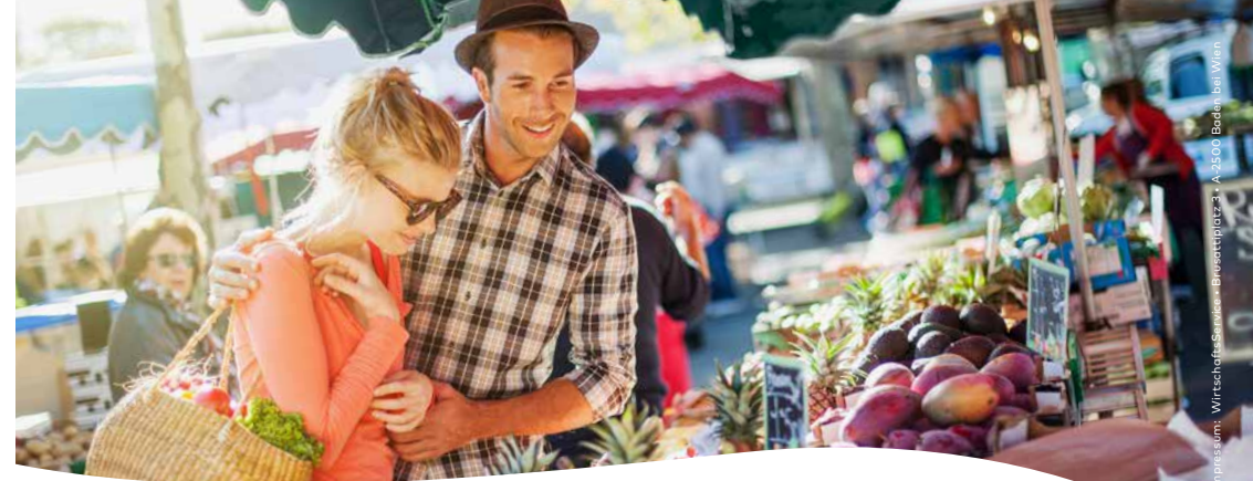
Impressum: Wirtschaftswissen - Brusattiplatz 31 - A-5300 Baden bei Wien